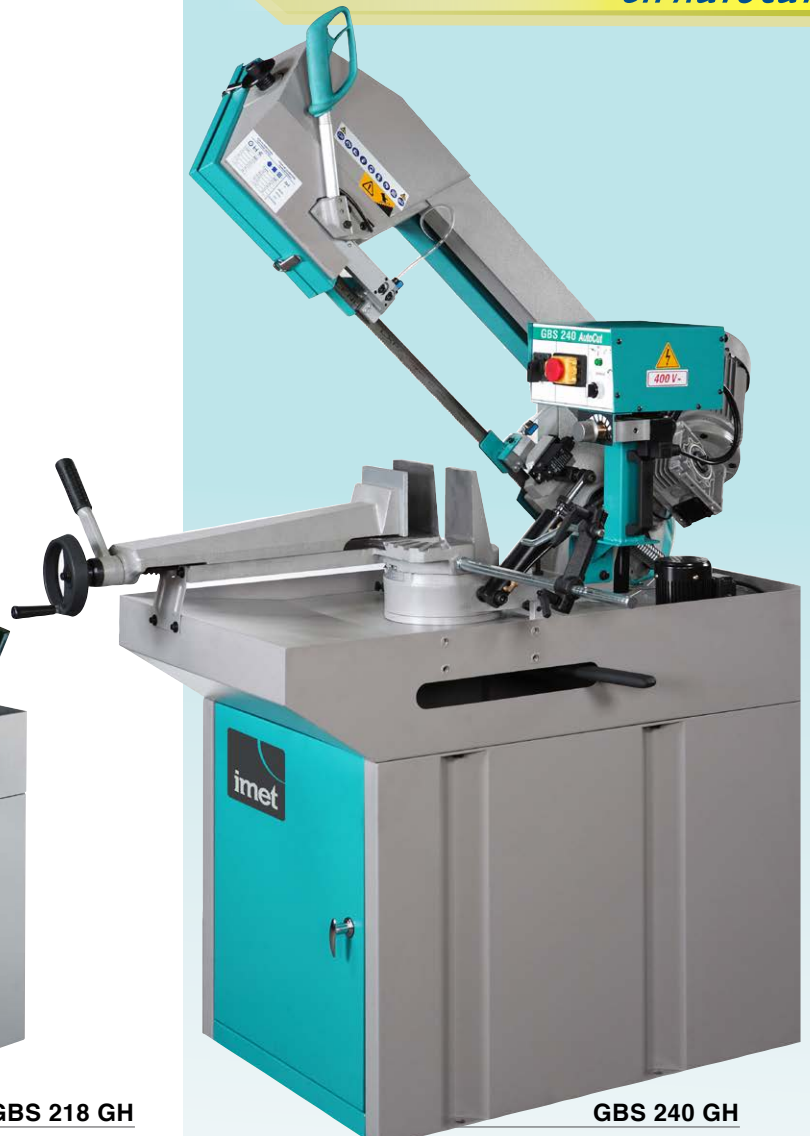
GBS 240 GH

IT - La segatrice manuale, o con discesa a gravità, ideale per la manutenzione e le piccole produzioni di profilati, tubi e solidi fino a 60° sinistra.