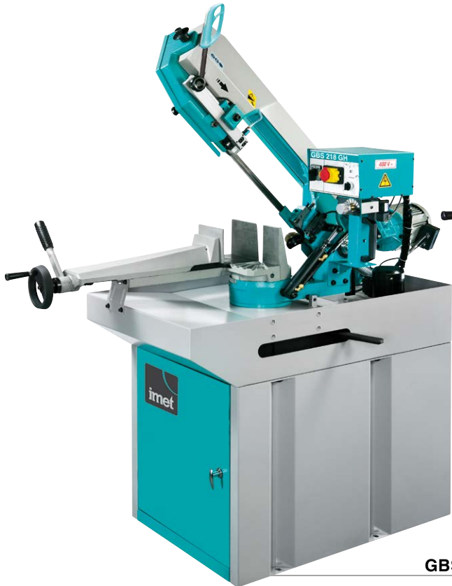
GBS 218 GH